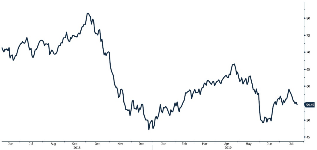
NAPHSINF Index (Asia Naphtha FOB Singapore Cargo Spot)