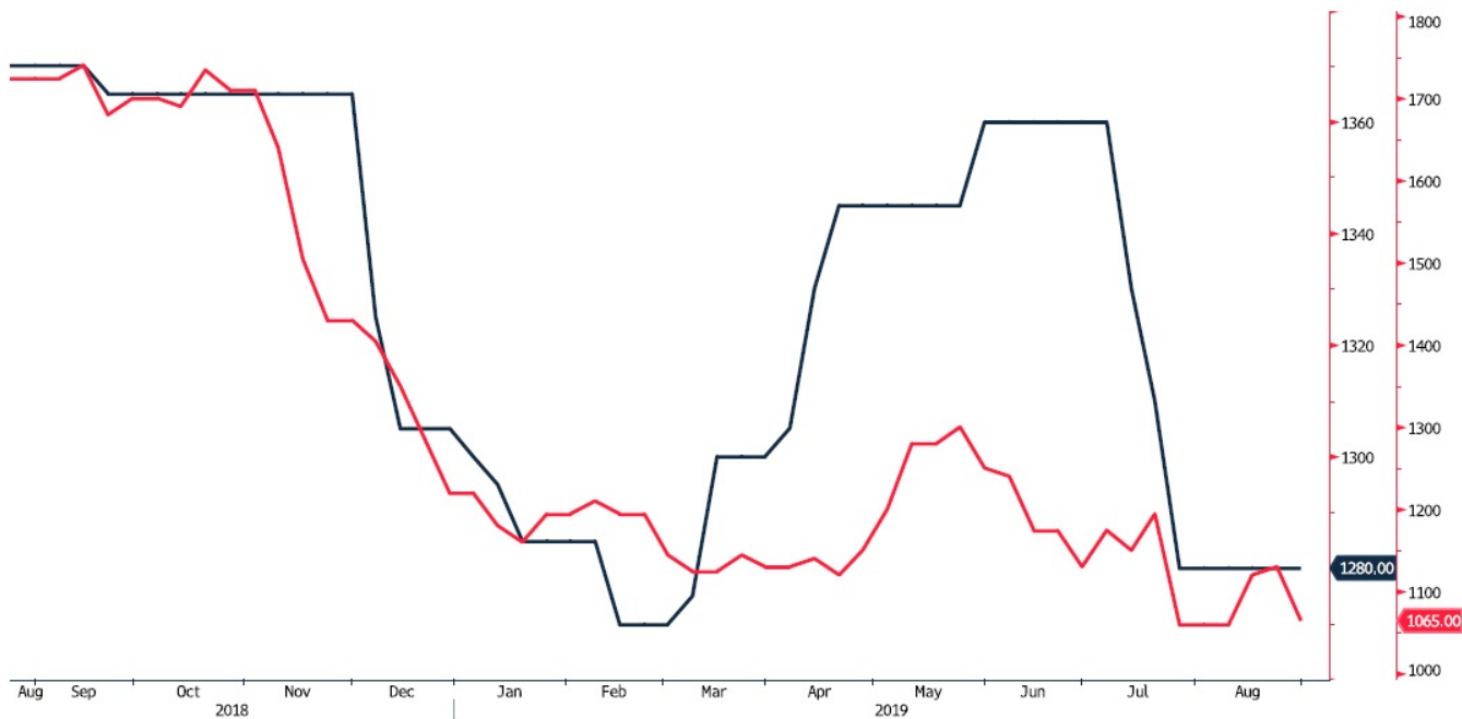
POLIHDGE Index (Germany HDPE Injection European Polymer Contract Price Euro/M) MERSCPHO Index (Houston PP copolymer Polymers FAS Price USD/MT Weekly)