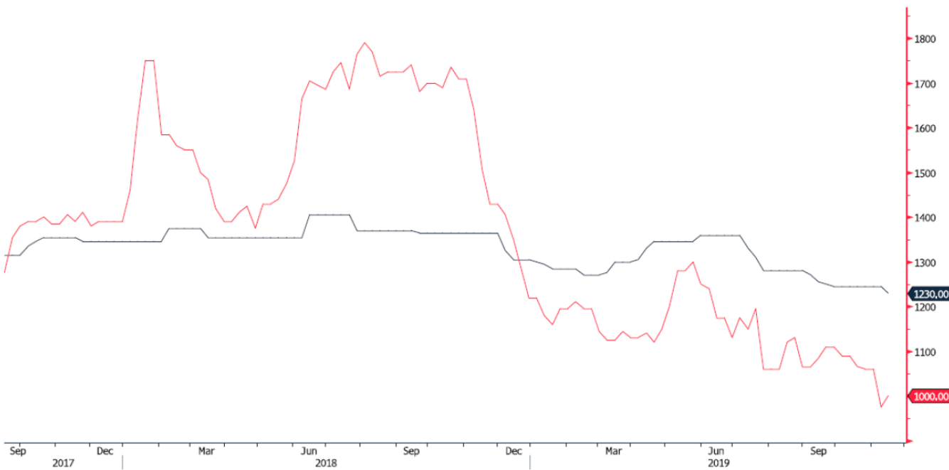
POLIHDGE Index (Germany HDPE Injection European Polymer Contract Price Euro/M) MERSCPHO Index (Houston PP copolymer Polymers FAS Price USD/MT Weekly)