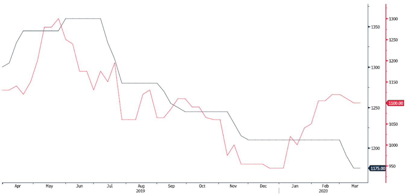
POLIHDGE Index (Germany HDPE Injection European Polymer Contract Price Euro/M) MERSCPHO Index (Houston PP copolymer Polymers FAS Price USD/MT Weekly)