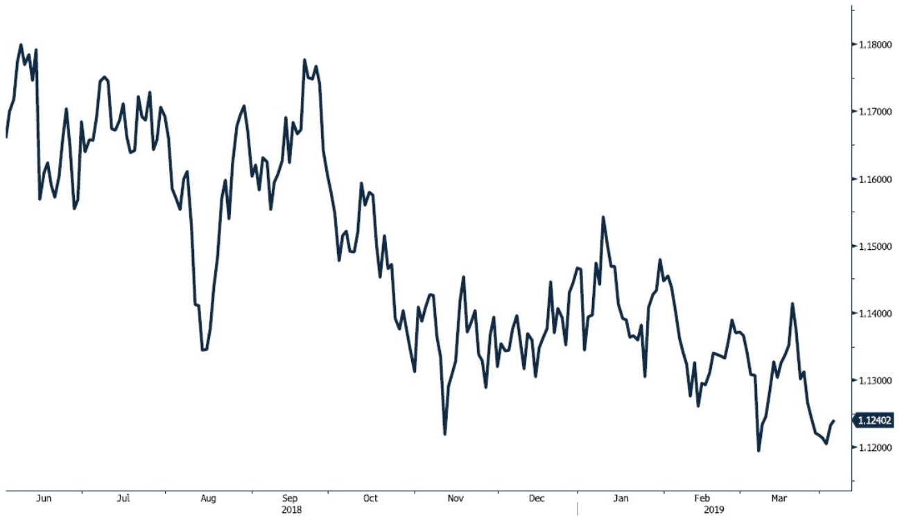
EUR Curncy (Euro Spot)