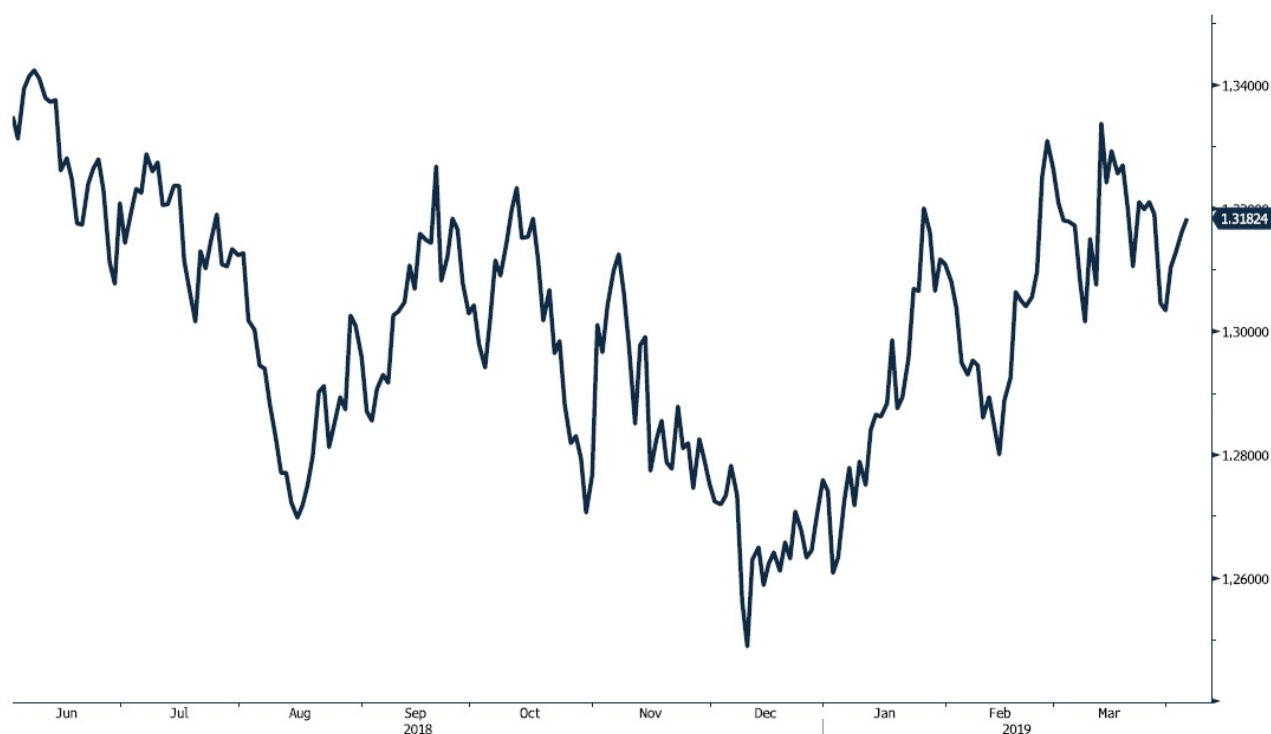
GBP Currency (British Pound Spot)