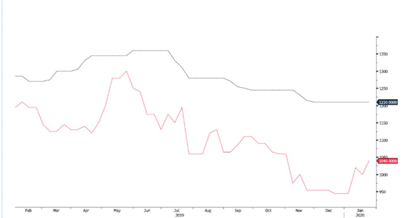
POLIHEDGE Index (Germany HDPE Injection European Polymer Contract Price Euro/M) MERSCPHO Index (Houston PP copolymer Polymers FAS Price USD/MT Weekly)