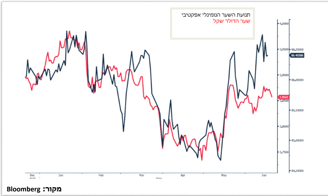
תנועת שער נומינלי אפקטיבי מול שער דולר שקל

דולרים. צעד של הבנק במטרה לשמור על תנאי הסחר של המשק המקומי, רווחיות היצוא ועתיד התעשייה המסורתית במשק הישראלי, החשופה ליבוא זול ומתחרה בתקופה של שיח ציבורי ומחאה הקוראת להוזלת המכסים ועידוד התחרות כצעד מרכזי בהוזלת העלויות לצרכן.