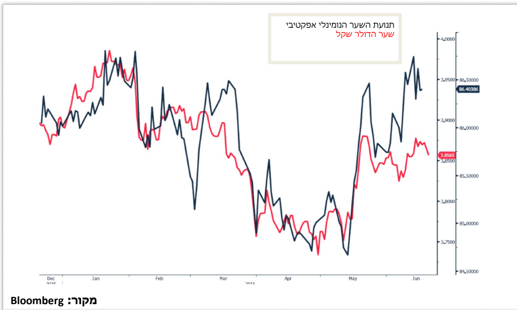
תנועת שער נומינלי אפקטיבי מול שער דולר שקל

דולרים. צעד של הבנק במטרה לשמור על תנאי השחר של המשק המקומי, רווחיות היצוא ועתיד התעשייה המסורתית במשק הישראלי, החשופה ליבוא זול ומתחרה בתקופה של שיח ציבורי ומחאה הקוראת להוזלת המכסים ועידוד התחרות כצעד מרכזי בהוזלת העלויות לצרכן.